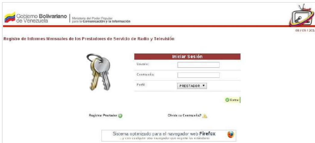
Imagen N° 1

Página inicial del Sistema Web para el Registro de los Informes de Programación (Ver Imagen N° 1).